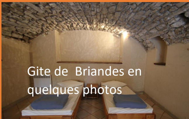
Gîte de Briandes en quelques photos