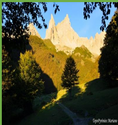
Les aiguilles d'Ansabere

Le cirque de Lescun, est un des plus beaux sites des Pyrénées en vallée D'Aspe. Rassurons-nous, nous nous approcherons des majestueuses aiguilles mais c'est autour du pic d'Ansabere 2271m, que nous irons randonner pour cette 8ème édition.